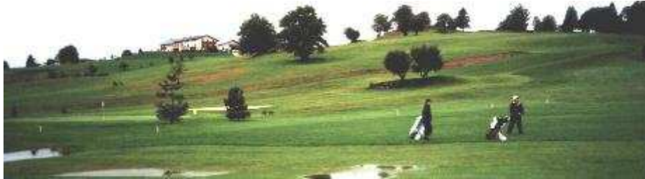
Golf du Mont Saint Jean

En cette fin septembre 2000, Jeunesse et Sport, fidèle à sa parole, a organisé la deuxième compétition de golf corporatif d'Entreprise au golf du Mont Saint Jean des Rousses ( 1100m). Sous un ciel bas et pluvieux en début d'après midi, nous avons pu apprécier la beauté d'un paysage soigné, mais rude.