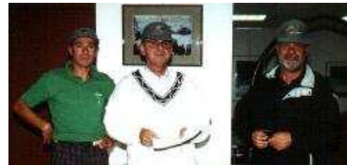
L'équipe de Jeunesse et Sport qui nous accueillait.