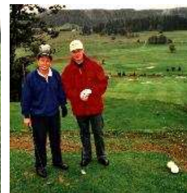
Les golfeurs au départ du trou n°1 ,au fond à droite.