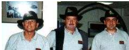
Chapeau à l'équipe Securitas d'Audincourt