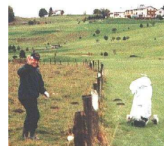
J'ai trouvé !